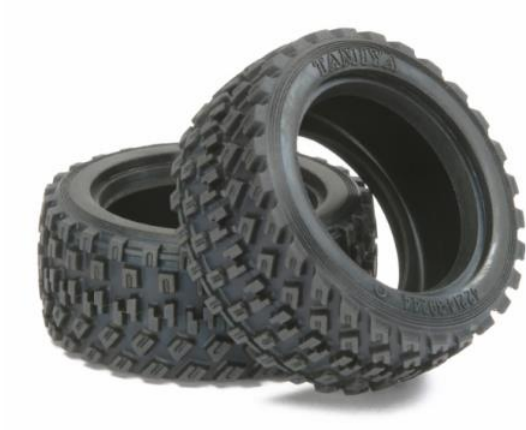
TAMIYA Rally-Block Reifen M-05Ra M-Chassis

Zugelassen sind die unten aufgelisteten Rallyreifen von Tamiya und Carten. Felgen müssen auch für das M-Chassis (Fabrikat egal) ausgelegt sein und dürfen maximal +/- 4mm Offset haben.