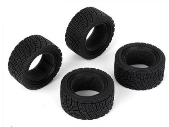
CARTEN M-Rally Reifen